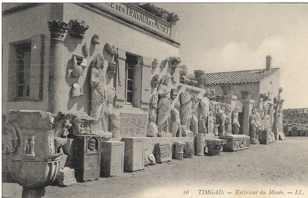
16 TIMGAD. — Extérieur du Musée. — LL,

Alemán de la intervención en Olimpia y Kerameikos donde tomó el relevo de la Sociedad arqueológica de Grecia en 1913. En todos ellos los museos y parte de los trabajos pudieron ser acometidos gracias a las aportaciones económicas de distintos mecenas. Otros proyectos con una gestión similar patrimonial fueron los yacimientos de Timgad en Argelia (Ballu, 1910) y Cartago en Túnez.