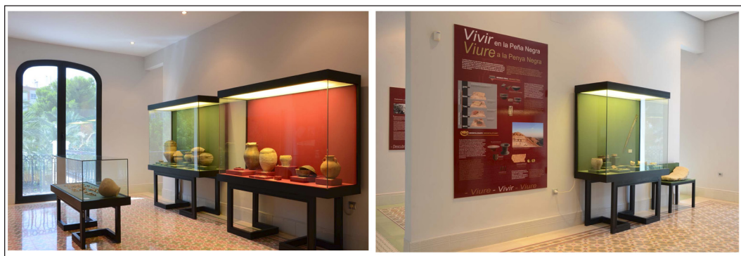
Fig. 4. Vista de las salas de la exposición temporal “Vida y Muerte en la Peña Negra”, abierta al público desde julio de 2015.