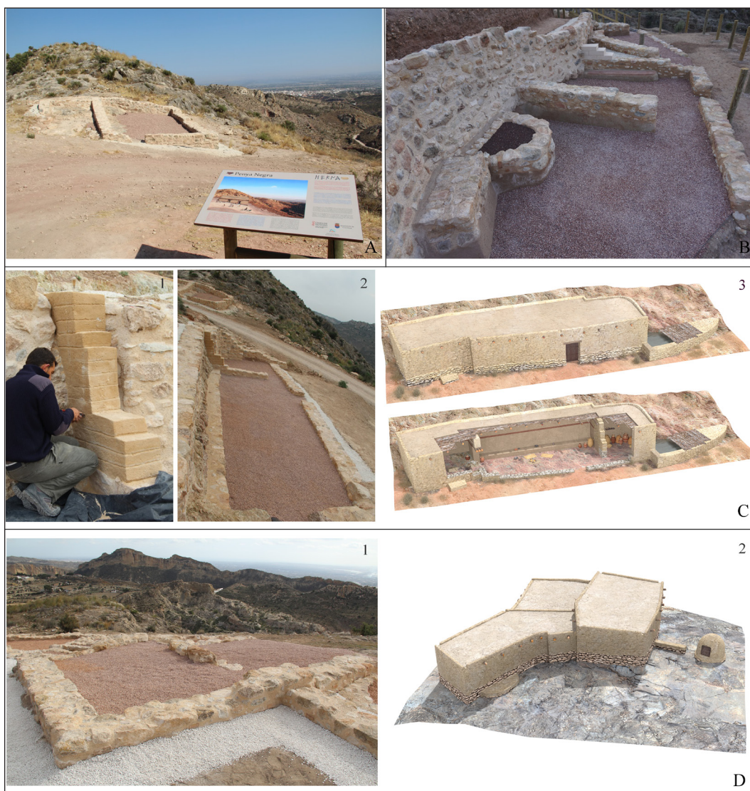
Fig. 3. Ejemplos de musealización del Parque arqueológico de Herna/ Peña Negra . A. Vista del edificio exento del Sector IIw tras su musealización y panel explicativo. B. Vista del barrio extramuros del Sector IB, tras su consolidación. C. Edificio singular tripartito del Sector IIw: 1. Proceso de consolidación de estructuras, 2. Vista del edificio tras su musealización. 3. Reconstrucción virtual. D. Edificio complejo del sector III: 1. Vista tras su consolidación y reconstrucción virtual del mismo.

Fotografías: A. Lorrio. Infografía: J. Quesada.