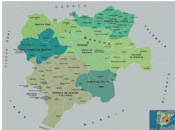
Mapa 1. Delimitación comarcal de la provincia de Albacete.

Enlace Video: https://www.youtube.com/watch?v=QWs435IEIqI