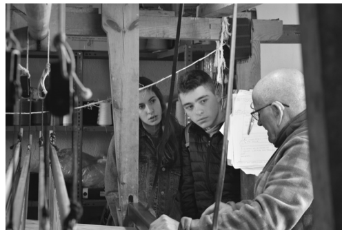
Figura 2. Imagen del trabajo de campo. En los talleres de Eustaquio en Casas de Lázaro