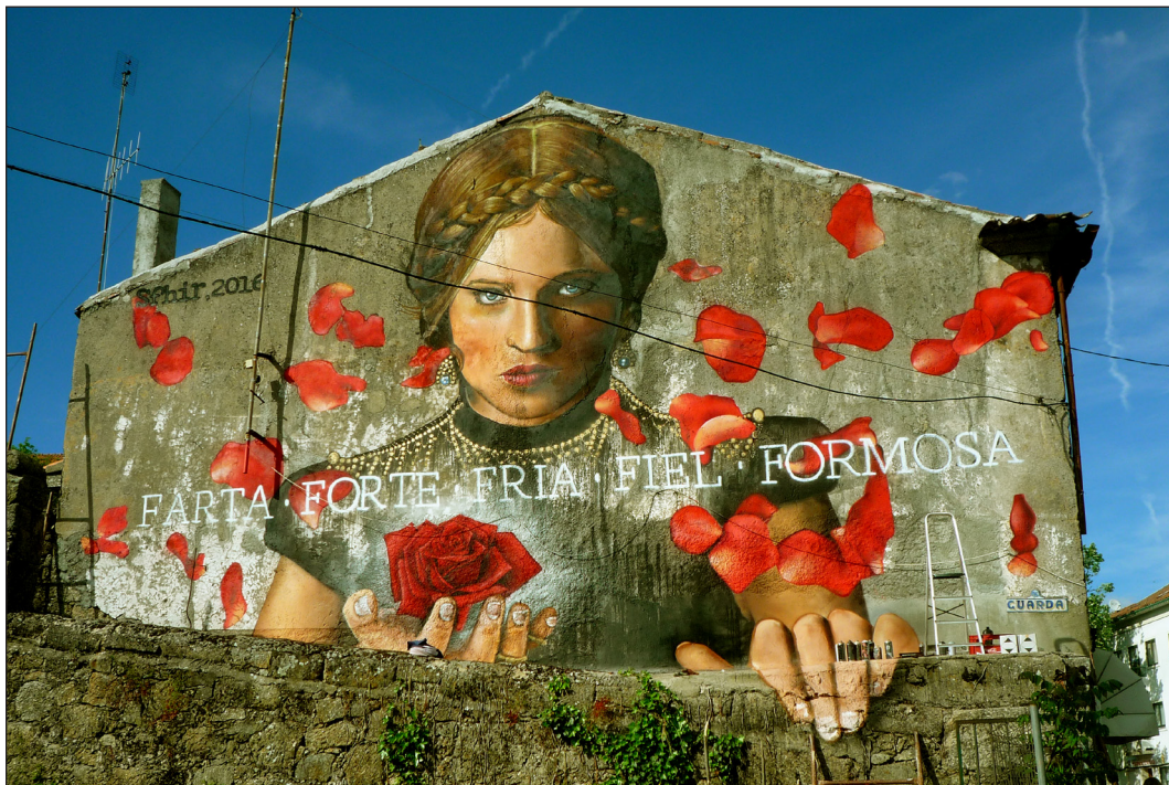
Fig. 7. SIAC#1: Os Efes da Ribeirinha, por Sfhir