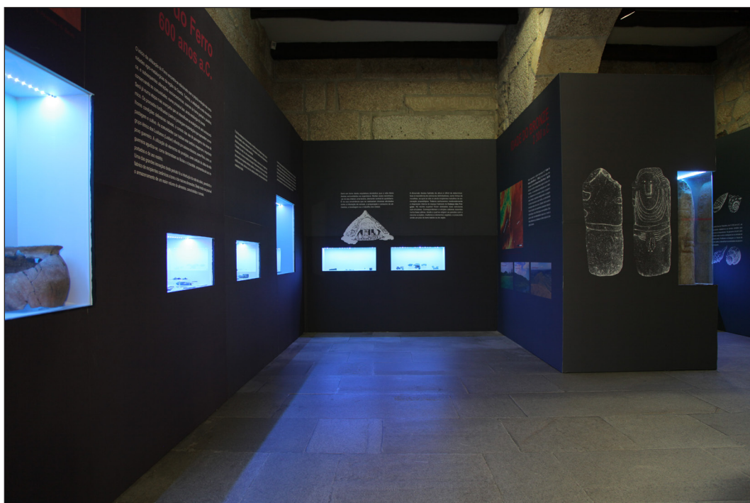
Fig. 4. Museu da Guarda: exposição permanente em 2017

coleções e pela sua programação cultural, constituem espaços privilegiados de transmissão de valores, manutenção da memória da(s) comunidade(s), integrando esses valores (sejam eles históricos ou não) na contemporaneidade.