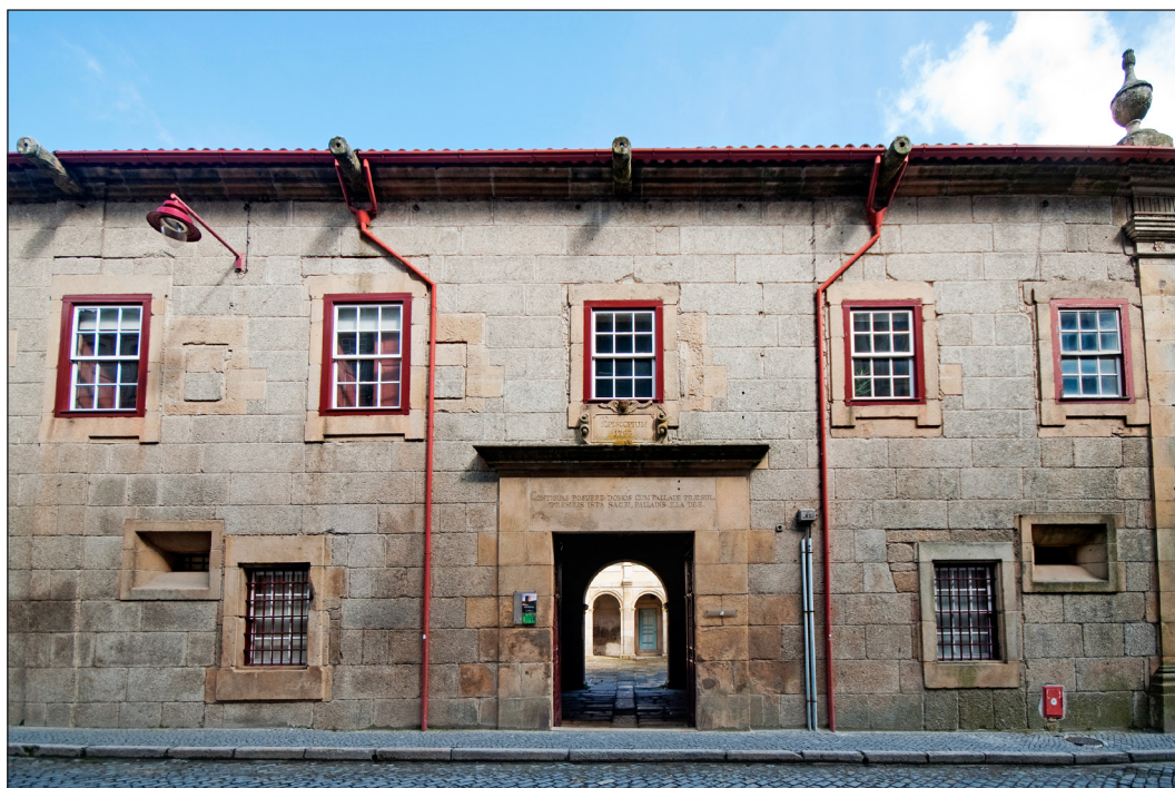
Fig. 1. Museu da Guarda

O objetivo final seria o de dotar a cidade de um equipamento museal que corresponda à crescente procura cultural, tanto para públicos nacionais como ibéricos.