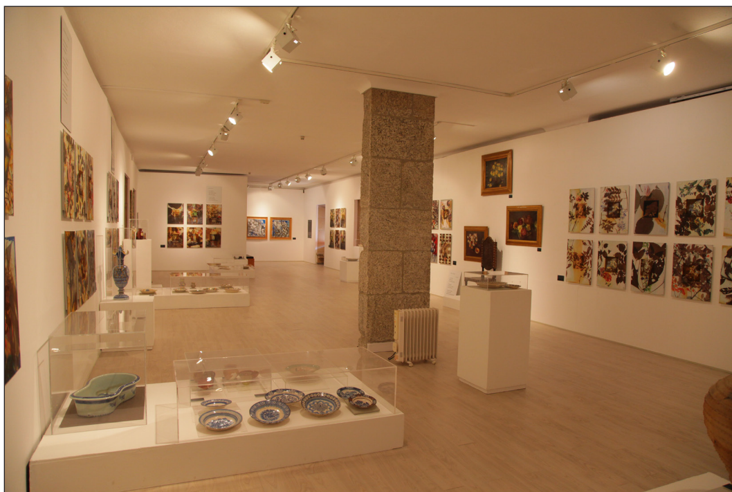
Fig. 6. Museu da Guarda: exposição Del Jardín del Bosco, de Florencio Maíllo

Propõem-se, assim, como linhas orientadoras gerais do Museu Regional da Guarda, a transdisciplinaridade e o comunitarismo. O Museu deve assumir-se como elemento aglutinador de tudo o que concorra para ‘narrar’ a história milenar da Guarda, não se podendo excluir desse processo multidirecional e transversal, sob nenhuma invocação, o contributo de cada elemento humano ou social presente na tessitura comunitária guardense. A seleção e a promoção de conteúdos programáticos terão sempre essa visão agregadora, desdobrando-se em tantas especificidades quantas as necessárias para melhor retratar as memórias da cidade.