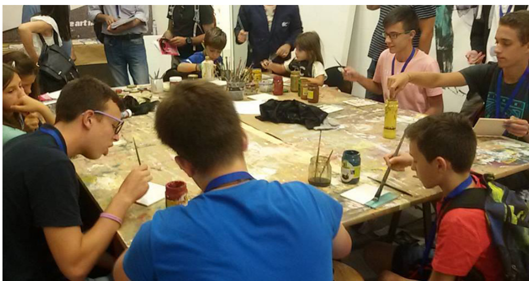
Fig. 9. Voluntariado no Museu