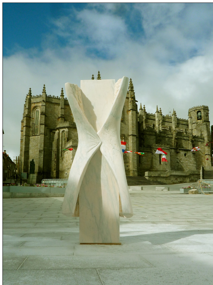
Fig. 8. SIAC#1: Metamorfose: de mulher a anjo, de Elena Saracino