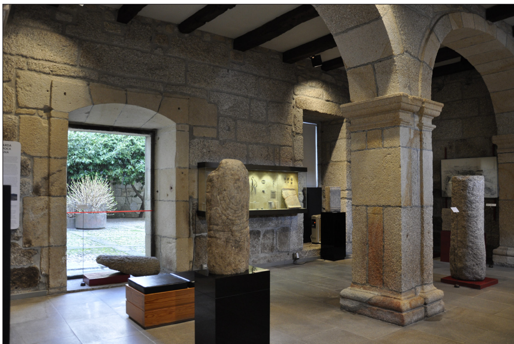
Fig. 3. Museu da Guarda: exposição permanente previamente a 2016

Idade do Bronze, uma fíbula anular hispânica (dos séculos v/vi a. C.), a coleção de numismática romana e um torso imperial romano do século II, atribuído a Trajano; na escultura, um granito policromado do século XIII, representando Nossa Senhora da Consolação com baldaquino e os espaldares de cadeiral dos séculos XVI e XVIII.