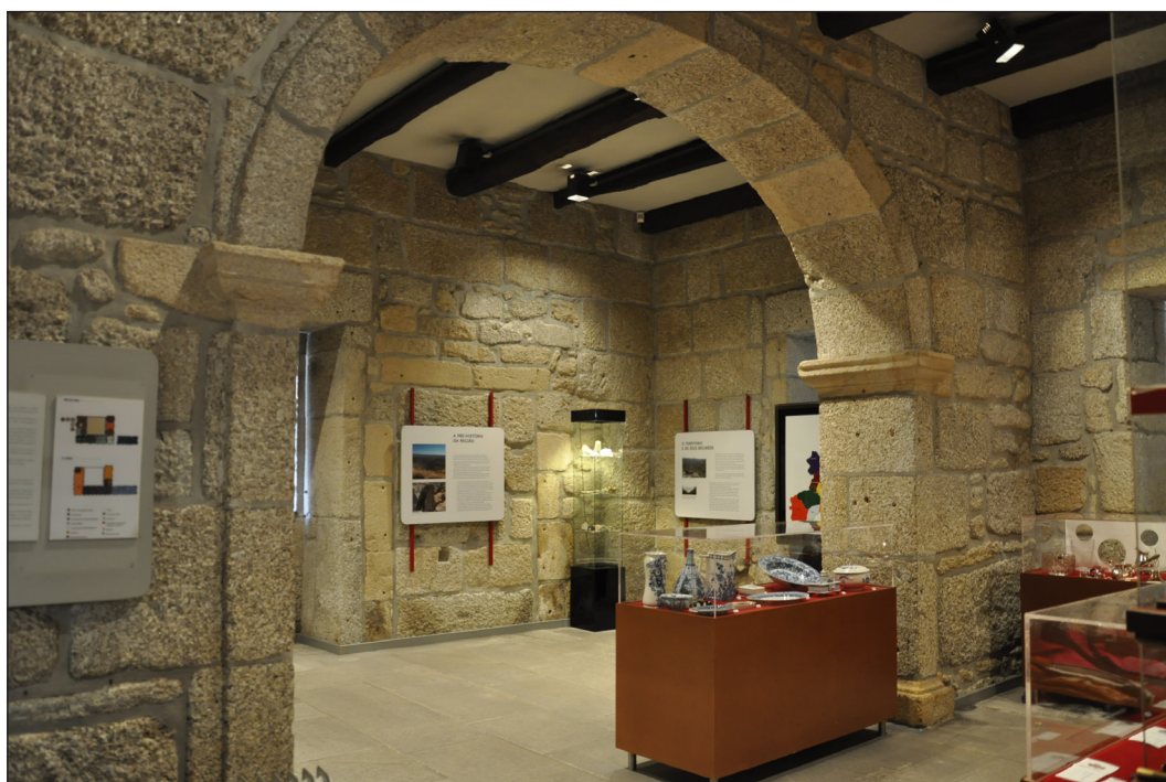
Fig. 2. Museu da Guarda: exposição permanente previamente a 2016

No início da década de 60 o Museu entra numa nova fase: a primeira mudança de tutela. Face às despesas de manutenção que a autarquia alegava não poder suportar, a mesma resolveu ceder à Junta Distrital os “bens mobilizáveis” da entidade museal (Borges, 2003: 64). Corria o ano de 1962. Mas a verdade é que se segue um período de grande desconhecimento da orgânica do museu, dada a exiguidade de documentação interna para esta data. Sabemos que as instalações foram novamente ampliadas até aos meados da década em apreço e em 1966 foi alvo, pela primeira vez, de programação museográfica.