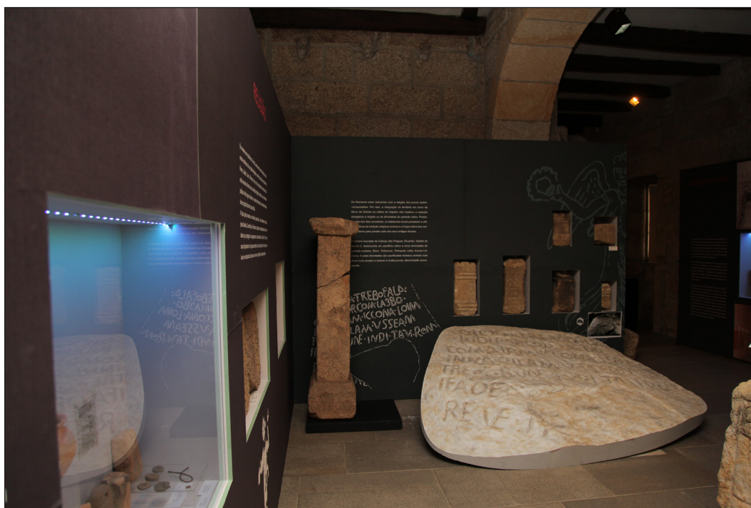
Fig. 5. Museu da Guarda: exposição permanente em 2017

Enquanto estrutura funcional, o Museu assume uma centralidade modeladora a partir do complexo urbano Antigo Seminário e pretende avocar uma natureza polinucleada que contemple diferentes espaços expositivos, históricos e culturais da cidade, do concelho e da região.