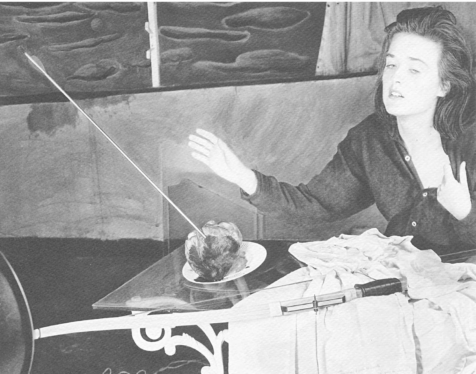
Autorretrato, Herida como la niebla por el sol (1987)