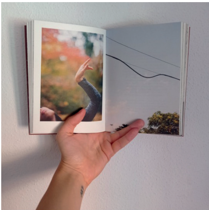
2. Páginas 74 y 75 de "Siempre van solos, los bichos". 2024.