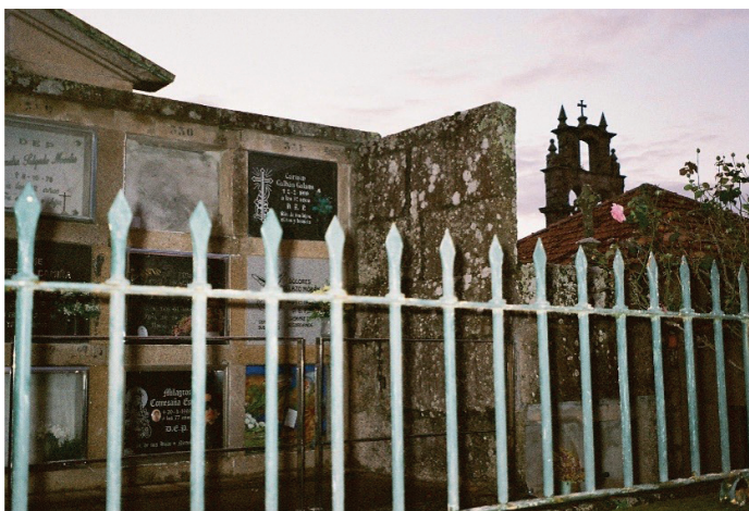
1. Rosa, cementerio. 2023. Fotografía analógica. Irene Mahugo