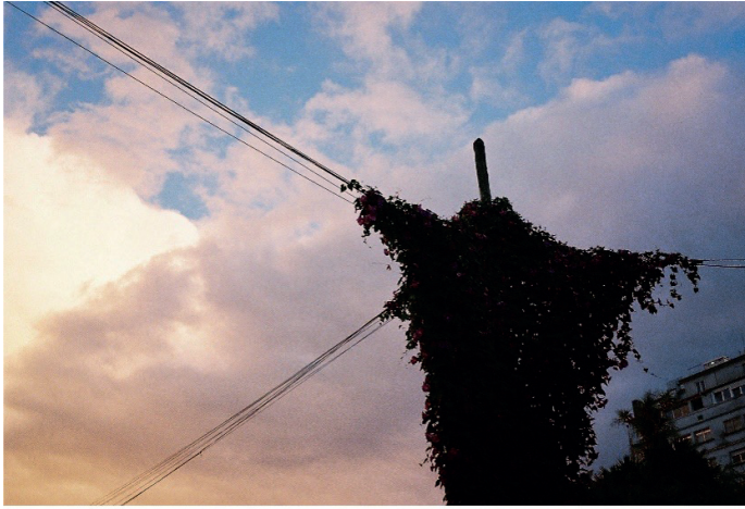
3. Trepando . 2023. Fotografía analógica.

Quisimos acercarnos a un descanso diverso, a un tiempo lento que es el tiempo del caracol, de la mantis, piii priir cruu criaj priirt , de la babosa y que así sea permanentemente.