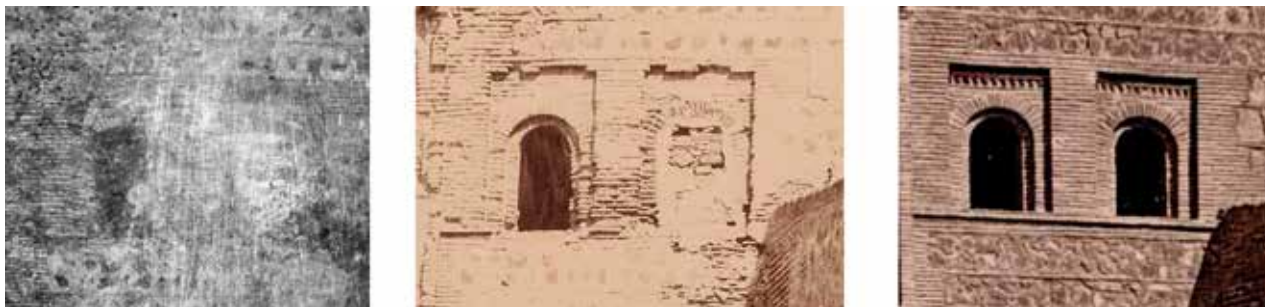
8. Puerta del sol, detalle de las ventanas arriba a la derecha: daguerrotipo, Clifford 1857, Alguacil h. 1879

es el mismo (o muy parecido) a las fotografías de Edward-King Tenison (1852) 20 , Oppenheim (1852) 21 , De Launay (1854) 22 , Carpentier (1856) 23 , Clifford (h. 1853, h. 1857 y h.1858) 24 (Fig. 7), Beaucorps (1858) 25 , Begué (1863-1865) 26 , Lamy (1863) 27