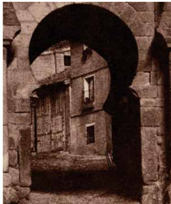
10. Puerta del sol , detalles de la vista a través de la puerta: daguerrotipo, col. David Blasco y Lola Toledo; calotipo, Gustave de Beaucorps, 1858

clamada por la Comisión de Monumentos de la Academia de San Fernando, que tuvo muchos problemas, desde que se hizo cargo de ella en 1857. Dicha restauración se inició en el año 1864 (llegándose a colocar andamios que se desmontaron sin usar) (GRACIA MARTÍN, 2008: 193, 263-67) y finalmente se llevó a cabo a lo largo de 1867, como informa la prensa toledana 29 .