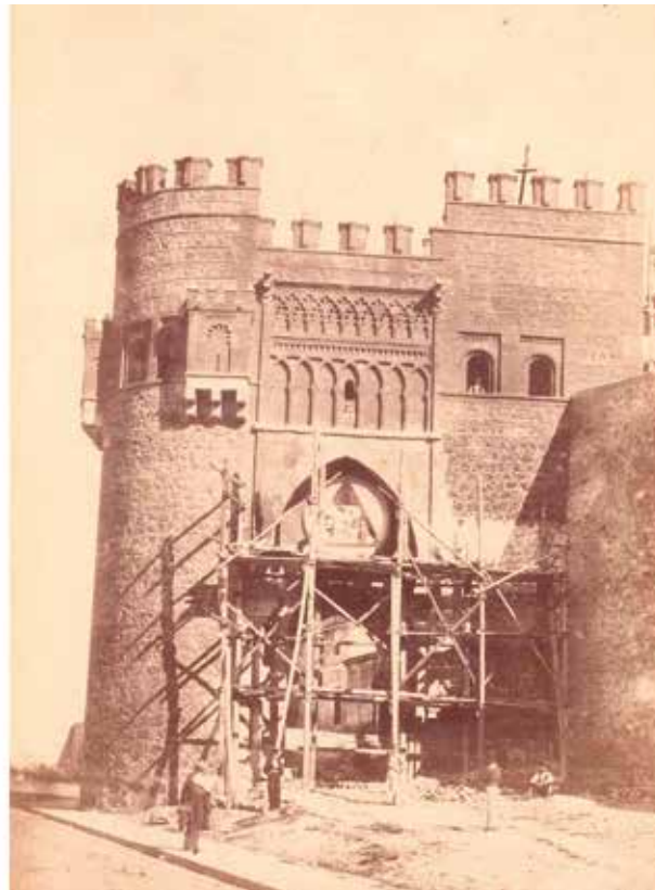
9. Puerta del sol con andamios . Jean Laurent, 1865, Madrid, Instituto del Patrimonio Cultural de España. MCF; Anónimo, 1866-7, Ciudad Real, Centro de Estudios de Castilla-La Mancha

y Alguacil (1866) 28 . En todas ellas, como en el daguerrotipo, la ventana de arriba a la derecha está cegada; es decir, que la ventana está cegada en todas las fotografías que se hicieron antes de la restauración de la Puerta (Fig. 8); una restauración re-