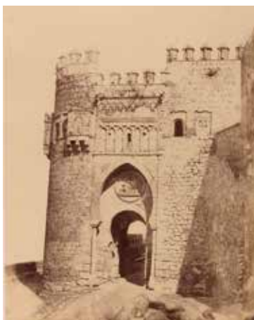
7. Puerta del sol , Charles Clifford, h. 1858, Madrid, Biblioteca Nacional

Manuel de Assas (1847-8) (Fig. 6). Desgraciadamente, el dibujo de Cecilio Pizarro (1825-1886), que guarda el Museo del Prado no nos sirve para esta comparación, porque solo recoge la parte izquierda de la puerta 19 .