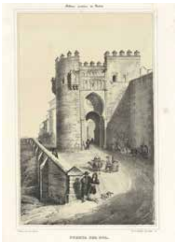
6. J. Vallejo, Puerta del Sol , litografía, Manuel de Assas, Álbum artístico de Toledo, Madrid, 1847-8