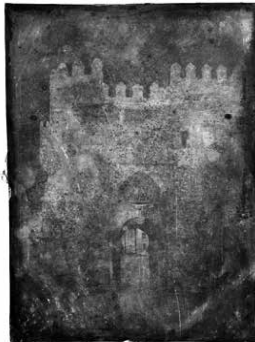
1. Puerta del sol , daguerrotypo, col. David Blasco y Lola Toledo. Foto Pep Parer

“Mi “pequeña historia” del daguerreotipo comienza así: Todo empezó el 26 de septiembre. Buscando, como casi cada día por internet, alguna carte-de-visite para seguir con mi colección de fotografía antigua, me tropecé con un vendedor (un particular) que tenía algunas de Barcelona. Al cabo de un rato, me envió una imagen con dichas fotografías, pero lo que me sorprendió fue lo que había debajo de ellas; a simple vista, pude distin-