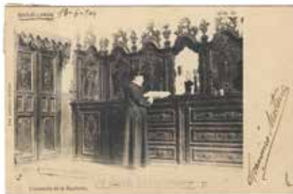
9. Socuéllamos. Cajonería de la Sacristía. Colección particular