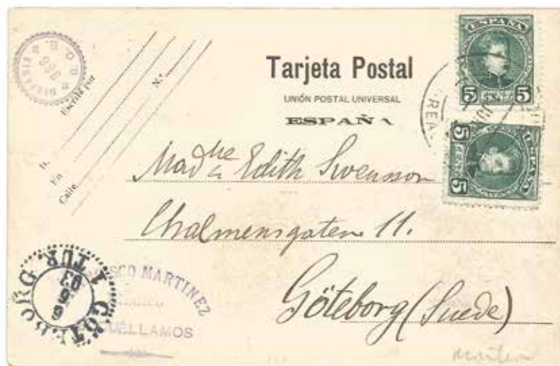
2 y 3. Socuéllamos. Baños de Archena, Puente del Segura.