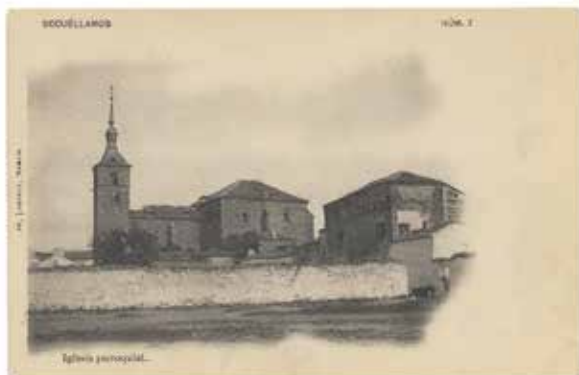
7. Socuéllamos. Iglesia Parroquial. Colección particular