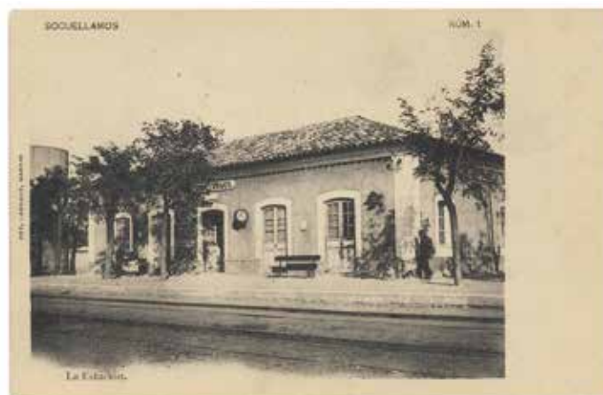
4. Socuéllamos. Estación. Colección particular

En el caso de la serie Socuéllamos, que la postal de portada, la número 1, fuera la estación de ferrocarril tiene su explicación. En los municipios que tuviesen ferrocarril y estación en aquella época, como el caso de Socuéllamos, la estación constituía sin lugar