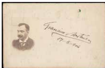
1. Colección particular, Barcelona