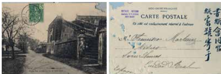
10. Socuéllamos. Porte Est (Intérieur de la Citadelle). Colección particular

fotográficas una vez reveladas, conozco dos procedimientos que con mucha frecuencia uso y me dan buenos resultados... 3