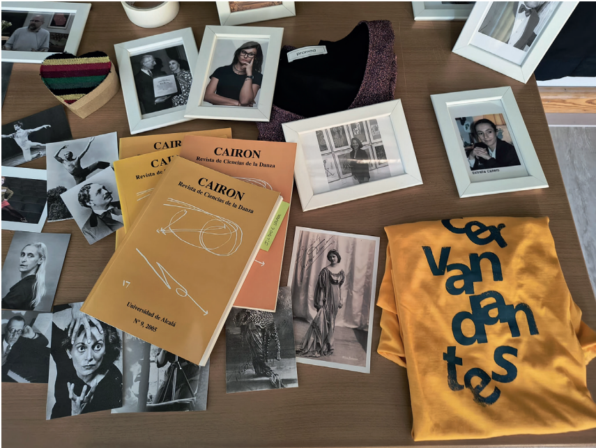
Retratos.