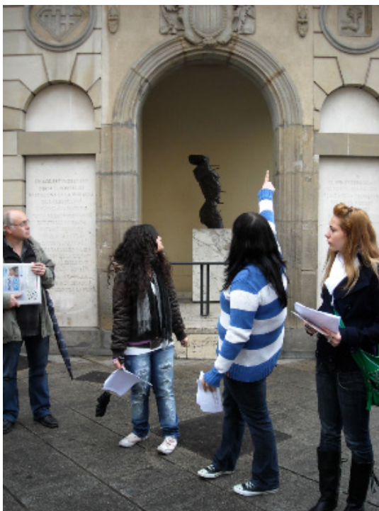
Fig. 6. Alumnas guiando el itinerario a un grupo de vecinos.