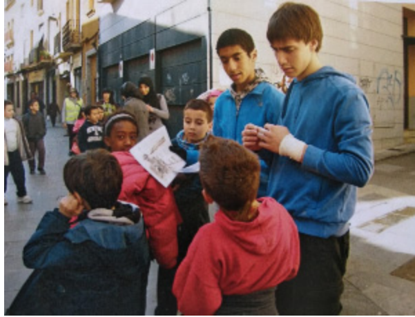
Fig. 4. Alumnos del instituto presentando las murallas a alumnos de primaria.

vistosa y recién rehabilitada, la Torre del Pou de la Sínia , un alumno de origen marroquí se dirigió en árabe a las madres con esta lengua materna. Ellas, emocionadas; y la autoestima del alumno, creciendo” (Illa, 2010). Un caso sin duda, de acercamiento al patrimonio como forjador de identidades compartidas, como herramienta de inclusión.