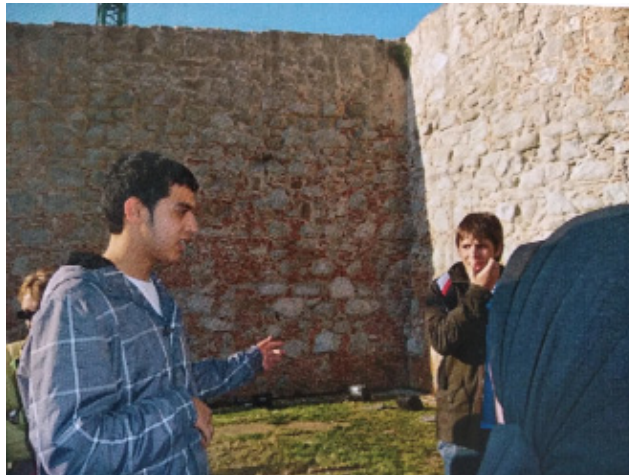
Fig. 5. Un alumno, de origen marroquí, explica un tramo de la muralla en árabe a las madres marroquíes.