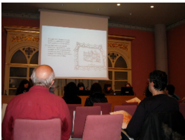
Fig. 7. Charla sobre el contexto histórico de la muralla realizada por alumnado participante en el proyecto.