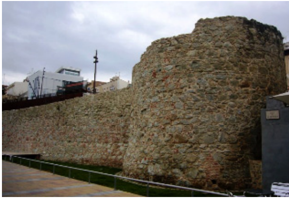
Fig. 2. Tramo de la muralla de can Xammar. Se observa una de las torres.

Escaletes hasta llegar, en línea recta, cerca de la calle del Hospital. En este último sector se conserva la planta de una torre destinada a la defensa del cercano barrio de extramuros del Pou d'Avall . Seguidamente giraba hacia el norte y atravesaba la actual bajada de las Espardenyes hasta llegar a la de Feliu . De aquí, pasando por detrás de los huertos de las casas de la calle de la Coma, se dirigía hacia la muralla de los Genovesos , girando hacia la prisión. Y después de seguir en dirección sur por las murallas del Tigre y de Sant Llorenç , acababa otra vez en el portal de Barcelona.