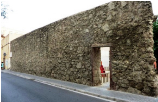
Fig. 3. Tramo recuperado de la muralla de los Genoveses.

El trazo de esta muralla puede seguirse hoy día en algunos lugares, existiendo todavía parte de los muros originales. En otros sectores se encuentra totalmente derruida o desfigurada por la urbanización posterior.