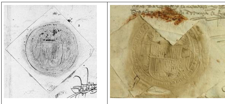
Figuras 5 y 6. Sellos de los Reyes Católicos.

Las ejecutorias de hidalguía, al igual que cualquier documento emitido por el rey, nos permiten un primer enfoque basado en la intitulación real que aparece al inicio. Esa sección del documento nos dice muchas cosas por sí mismas, como ya señalamos respecto a la figura 3. No obstante, si comparamos la de un soberano con las de sus sucesores en el trono, podemos observar la evolución territorial de la Corona, e incluso las vicisitudes políticas por las que podía estar pasando el reino en un momento determinado. Esto sucede, por ejemplo, si nos fijamos en la figura 4, un documento de noviembre de 1525 encabezado por el emperador Carlos, rey de Alemania, y doña Juana, su madre. A partir de ahí, el resto de títulos... Ello puede darnos pie para explicar, por ejemplo, la revuelta comunera y el papel de la reina Juana de Castilla. Por supuesto, a través de la intitulación también podemos profundizar en conocimientos geográficos, situando sobre un mapa todos los territorios que aparecen mencionados, y heráldicos, viendo cuáles eran los diferentes escudos que los representaban. Estos mismos aspectos se observan si nos fijamos en los escudos de los sellos de placa, en los que podemos ver qué territorios aparecen reflejados y, comparándolos, la evolución política de la monarquía: en la figura 5 no aparece el Reino de Granada, mientras que en la figura 6, sí.