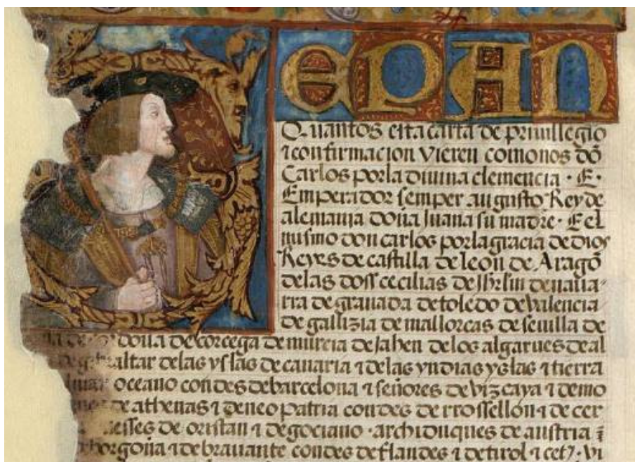
Figura 4. Fragmento de una carta de Carlos I al Concejo de la Mesta.

Hechas estas precisiones, continuamos presentando algunas formas en las que podemos utilizar la fuente manuscrita para enseñar contenidos de Historia Moderna en el aula de Educación Secundaria Obligatoria. Para ello, nos hemos centrado especialmente en las ejecutorias de hidalguía, un tipo documental que ofrece muchas y muy buenas posibilidades para enseñar contenidos de carácter social, político, geográfico, lingüístico, artístico, etcétera, como ya pusiera en valor Elisa Ruiz hace algo más de una década (2006: 266-273).