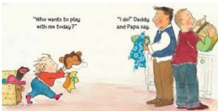
Figura 1. Presentación de los personajes. Ilustraciones segunda y tercera tomadas de Daddy, Papa and Me (2009) de Léslea Newman © Tricycle Press.

entre la importancia que se concede a ambos padres en la historia, dado que ambos modos ofrecen informaciones distintas, pero complementarias.