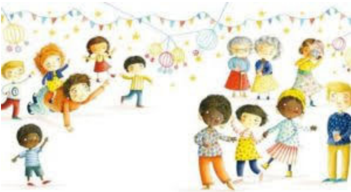
Figura 2. Representación de Stella con Papa y de Daddy con los adultos. Ilustraciones vigésimo cuarta y vigésimo quinta tomadas de Stella brings

tificar a Stella y la “caracterización” para designar a los padres (“Daddy” y “Papa”). La manera en la que la niña se refiere a sus padres en el modo textual denota un equilibrio en cuanto a la importancia que cada uno de ellos tiene en la estructura familiar. Del mismo modo la representación visual plantea esta misma situación de igualdad: aunque Papa está representado en la parte derecha de la ilustración la primera vez que Stella aparece con sus dos padres, Daddy es el primero que se menciona en el texto escrito cuando sus compañeros le preguntan a Stella sobre su familia. Es notable, a su vez, que Stella aparezca con sus dos padres en todos los casos, a excepción de la ilustración contenida en la vigesimocuarta doble página en la que está sola con Papa (véase Figura 2). Además, resulta significativo que, de los seis casos en los que Stella se representa junto a sus dos padres, cada uno aparece en la parte derecha de la ilustración tres veces. Este patrón equilibrado en la ubicación de los dos padres en el modo visual sugiere la misma importancia que se otorga a ambos en cuanto a su implicación en los cuidados y el afecto que los dos progenitores mantienen con su hija.