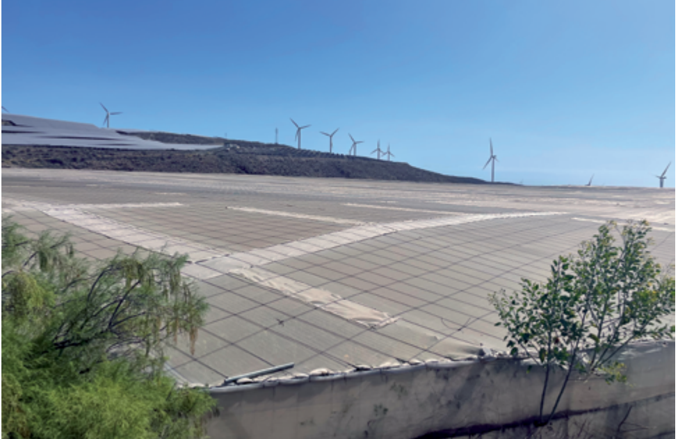
Invernaderos, Aerogeneradores y Jardines solares