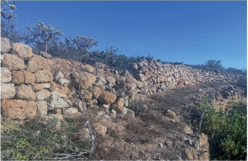
Muros de los canteros hoy abandonados.