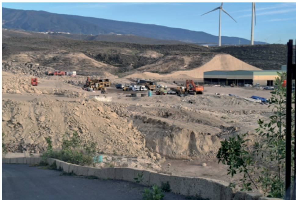
Cantera con excavadoras, molinos de viento al fondo de la imagen.