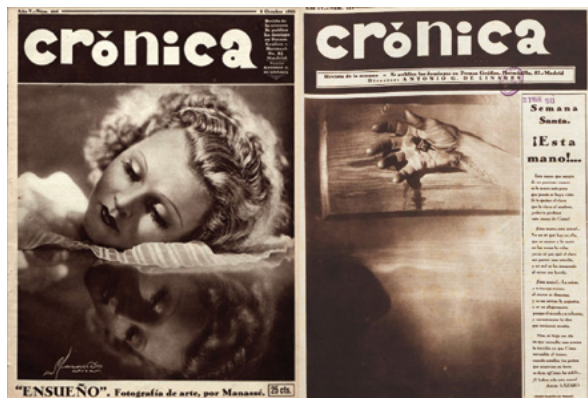
Fig. 2. Obras de Manassé en las portadas de Crónica. “Ensueño” (1933/10/08) y “¡Esta mano!...” (1932/03/20)