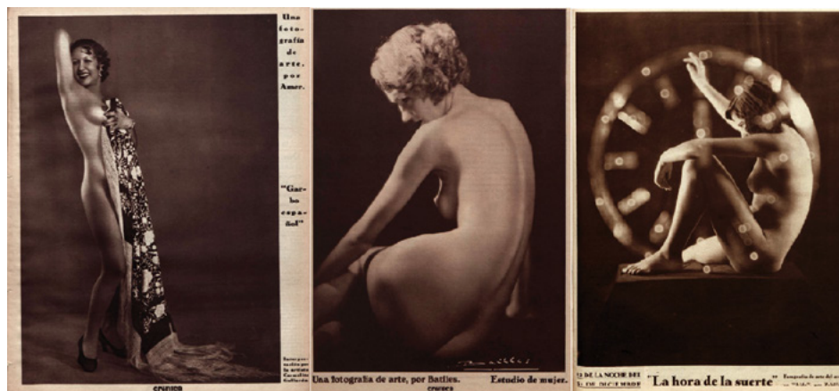
Fig. 9. Fotografías de arte de autores españoles. De izquierda a derecha: "Garbo español" por Amer (1933/11/12), "Estudio de mujer" por Battlés (1935/02/17) y "La hora de la suerte" por Zubillaga (1933/12/31)