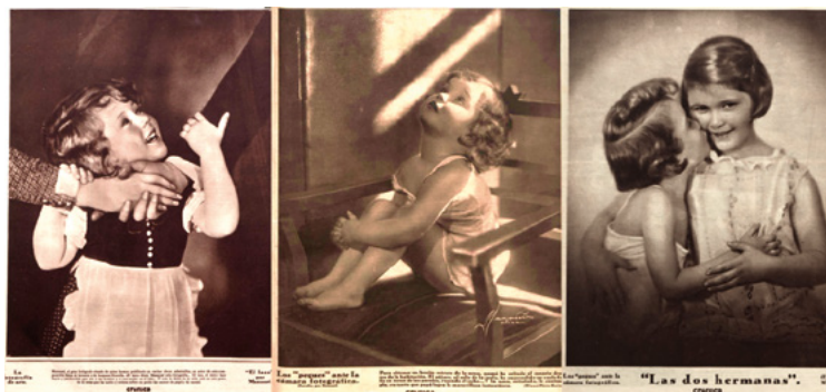
Fig. 4. Retratos infantiles de Manassé publicados en Crónica. A la izquierda “El lazo” publicada con el siguiente pie literario: “El lazo, el único lazo fuerte y perdurable que une a un hombre y una mujer es el hijo...Y toda la dicha de la vida está en este gesto de la nena, que ha unido y retiene sobre su pecho las manos de papá y de mamá” (1933/07/29). La imagen del centro (sin título) se publicó acompañada del siguiente texto: “Para obtener un bonito retrato de la nena, mamá ha soltado al canario dentro de la habitación. El pájaro, al salir de la jaula, ha emprendido el vuelo feliz en torno de las paredes, rozando el techo...Y la nena extasiada, le contempla, en tanto que papá logra la maravillosa instantánea” (1933/06/01). A la derecha “Las dos hermanas” (1933/07/16)

El análisis global permite concluir que los escenarios, modelos y composiciones fueron objeto de una cuidada preparación donde el autor/fotógrafo desempeñó la función de director de escena, y el modelo acapara todo el protagonismo, con un resultado que combina el glamour, el erotismo y la seducción. Estas composiciones se han clasificado en tres grupos: desnudos naturales, en los que el cuerpo es el protagonista; Simbólicos o alegóricos, en los que el vestuario y los objetos constituyen elementos evocadores de ideas o conceptos; y un tercer grupo relacionado con poses y escenas de baile y danza.