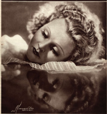
"ENSUEÑO". Fotografía de arte, por Manassé. 25 cts.

Revista de la semana de poesía que publica los poemas de los poetas de España y del extranjero de los poetas de España