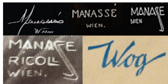
Fig. 1. Firmas y sellos del Atelier Manassé en diferentes etapas

En cuanto al formato de presentación, la mayor parte las imágenes (219) están publicadas a página completa (24x32 cm) y en posición vertical. El resto de imágenes (44) responden a otros formatos y solo cinco se publicaron en horizontal. La calidad de la impresión, en huecograbado en tono sepia, unido al formato a página, favoreció un mayor impacto visual en los lectores.