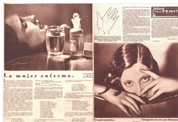
Fig. 3. Artículos de la revista Crónica ilustrados con fotografías de Manassé. A la izquierda, “La mujer enferma” de Ramón Lobo Regidor (1934/03/08). A la derecha, artículo “La quiromancia al alcance de todos” de Elena Fortún (1935/12/01)

De los más de doscientos retratos, solo 49 están identificados con los nombres de las artistas.