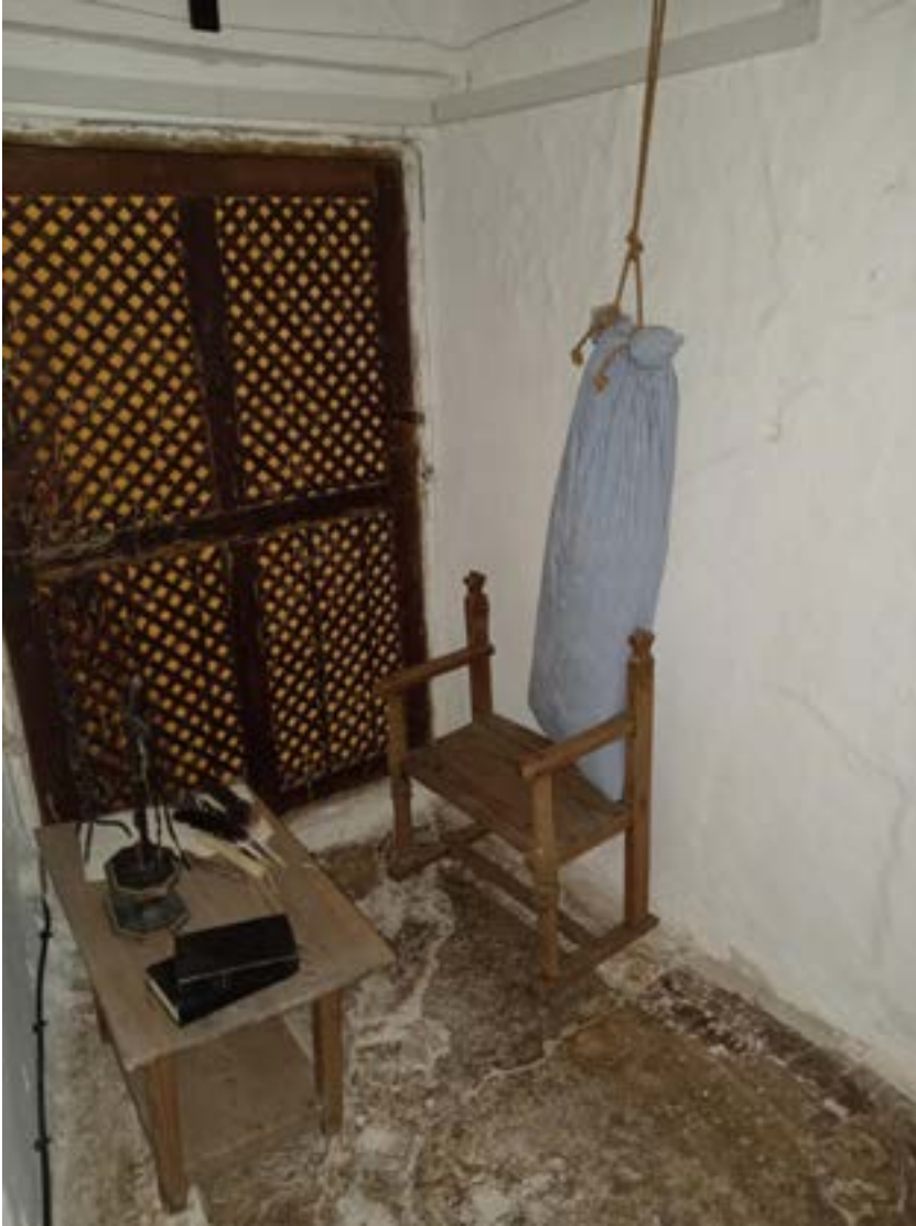
Fig. Celdita de sor Mencía en el coro alto.