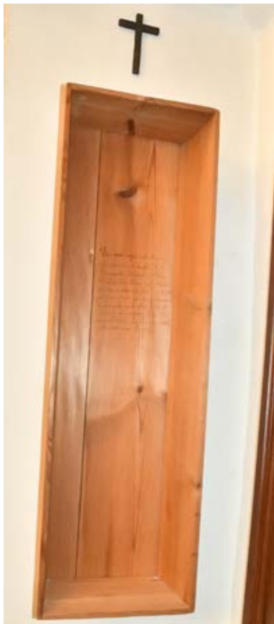
Fig. 8. Ataúd de sor Mencía.