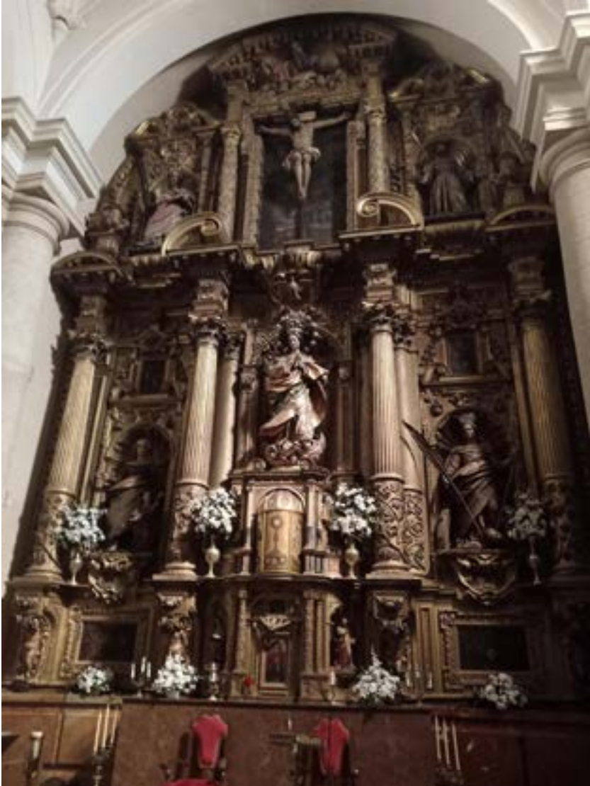
Fig. 1. Altar Mayor de la capilla del convento de Santa Ana.