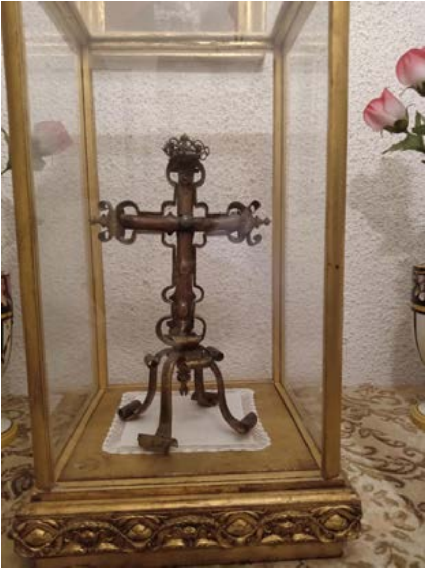
Fig. 7. Cruz de sor Mencia.