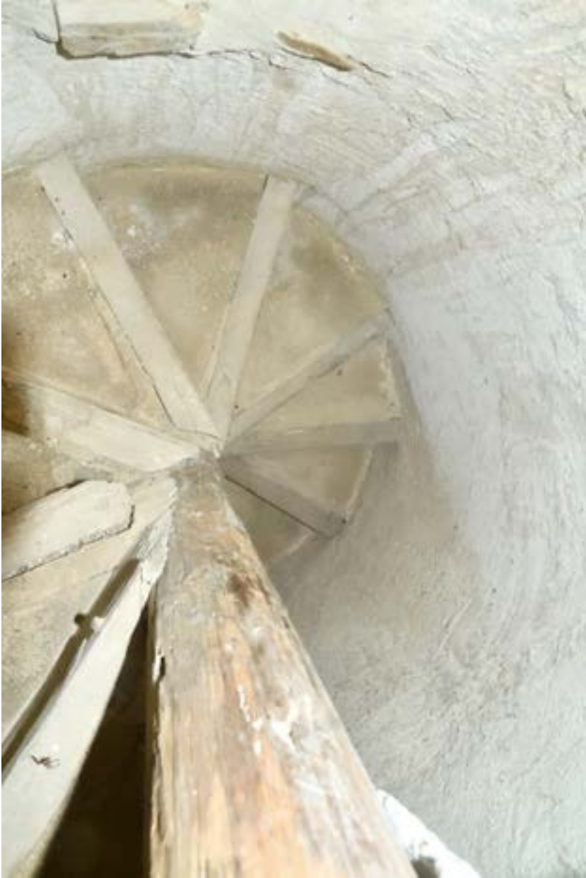
Fig. 5. Escalera campanario.