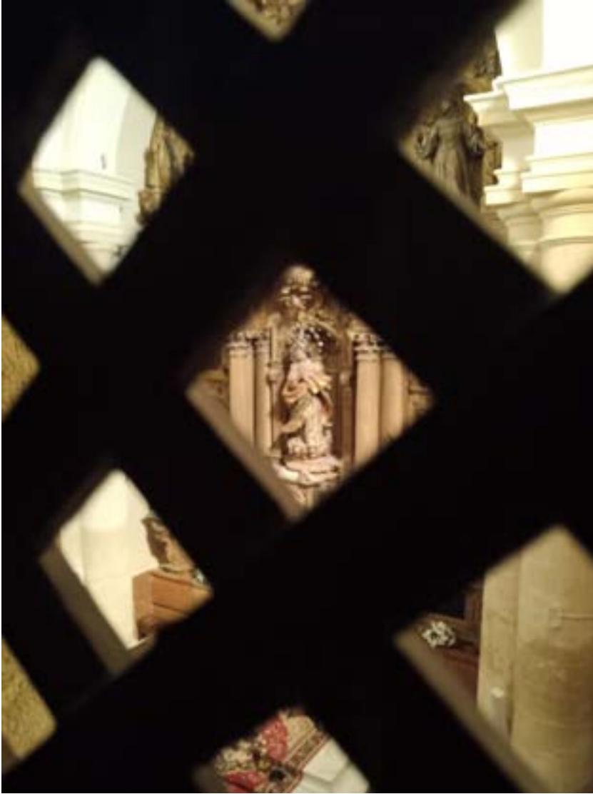
Fig. 3. El Altar Mayor a través de la celosía de la celdita del coro alto.