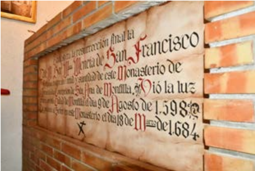
Fig. 9. Sepultura de sor Mencia en Santa Ana de Montilla.