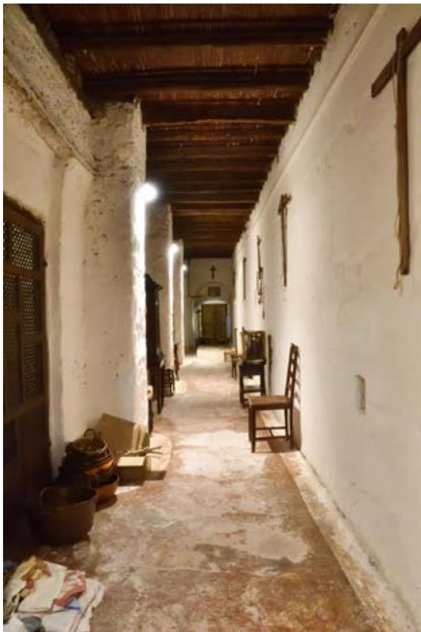
Fig. 4. Corredor que conduce a la celdita del coro alto.