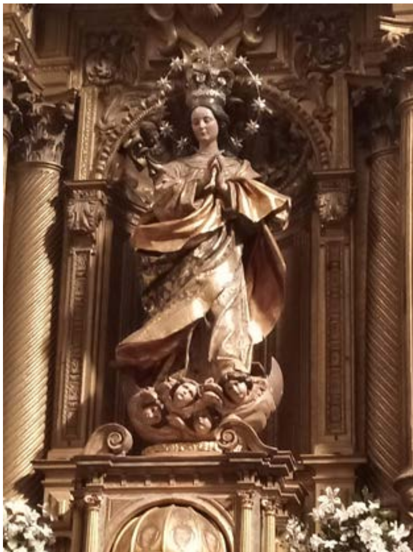
Fig. 6. Virgen Inmaculada.