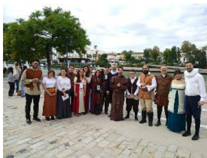
nº 12.- Feria del Emprendimiento (Programa INNICIA). Lugar: Bajos del Marqués del Contadero junto al río Guadalquivir, Sevilla 6 de junio de 2018